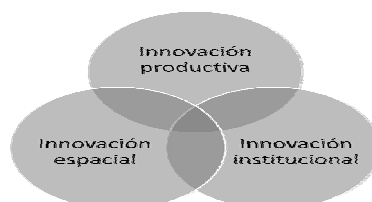
ILUSTRACIÓN 1. LA TRIPLE VISIÓN DE LA INNOVACIÓN UNIVERSITARIA

de mejora que supone un cambio novedoso de los planteamientos y métodos de su docencia". El fomento de la innovación docente es una de las principales vías, no la única, con las que las Universidades están fomentando la mejora de su calidad docente y a la vez están respondiendo a los nuevos cambios del contexto universitario.